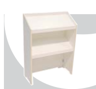
2... ESPOSITORI 835 x 330 x 1160 mm.