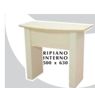
2... BANCHI 1100 x 560 x 1160 mm.