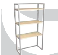
2... SCAFFALI 800 x 300 x 1500 mm.