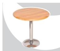
5... TAVOLI Ø 800 mm.