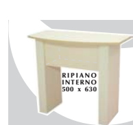
1... BANCO 1100 x 560 x 1160 mm.